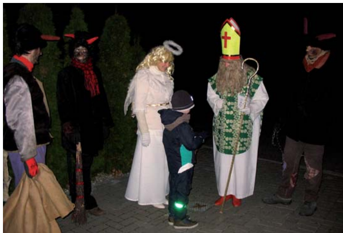
Tenhle statečný klouček nejenže bezchybně odříkal básničku, ale také donesl sv. Mikuláši vlastnoručně vyrobený dárek.