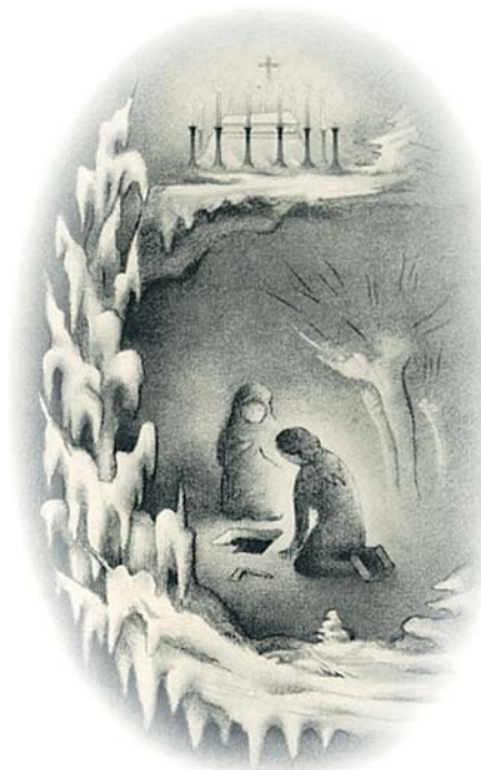
Štědrý den – K. J. Erben, Kytice