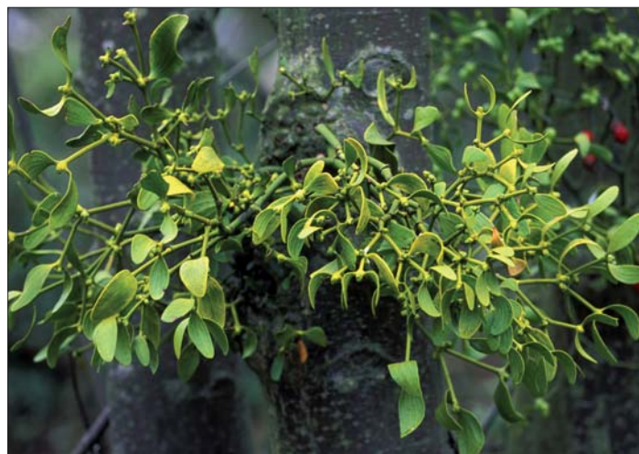
Jmelí bílé / Viscum album

V moderním lékařství se výtažek ze jmelí používá jako prostředek zabraňující nádorovým onemocněním, k regulaci krevního tlaku, při metabolických onemocněních.