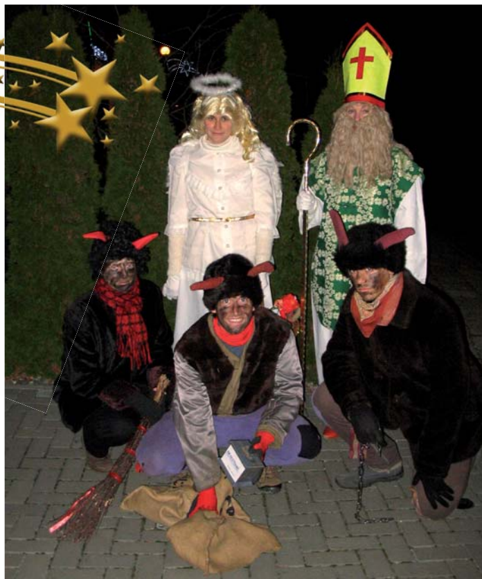
Sv. Mikuláš s celým svým doprovodem

Čertovský pytel na neposlušné děti letos zůstal prázdný. Znamená to, že ve Slatinkách máme jen samé hodné potomky :-) Tak zase za rok na viděnou, budeme se těšit!