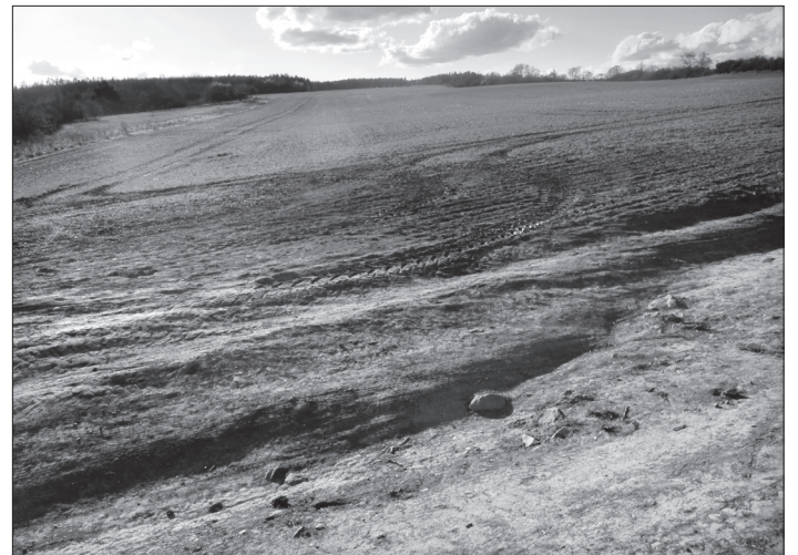
Naše lány v kopcích Kobyli hlava, Slatinky.