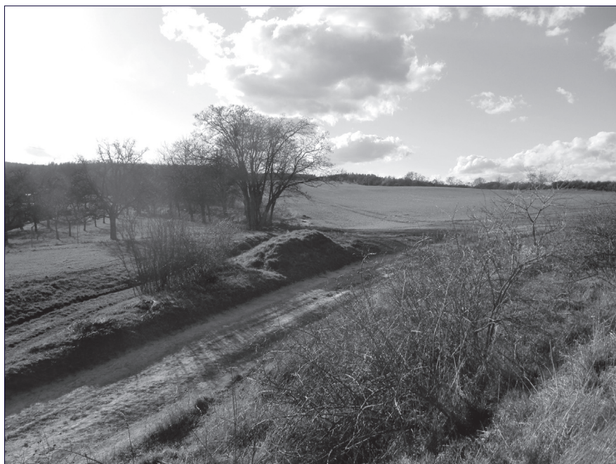
Zde má vyrůst „vodní dílo“ Slatinky.