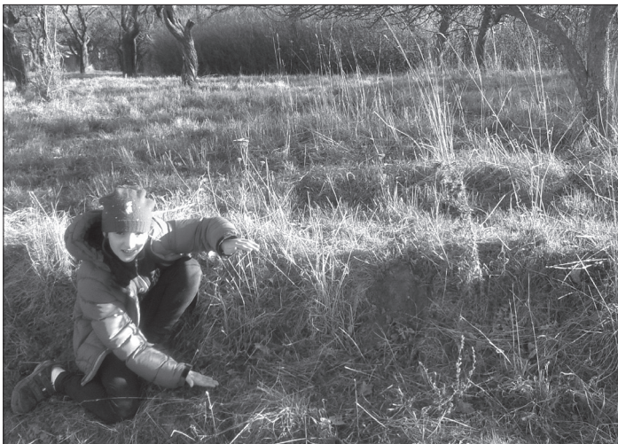
Kdo vám zaplatí za úbytek ornice na vašem pozemku? Kobyli hlava, Slatinky.

Dobrá. Podívejte se na to z hlediska hodnoty. Na vašem pozemku leží ornice-hlína. U nás na Hané – výborná. Pokud si půjдете koupit hlínu do Hornbachu, za pytel takové hlíny (30 kg) zaplatíte bez mrknutí oka kolem 100 Kč. Takových pytlů na každém svém metru naberete s přehledem dvacet a ještě zdaleka nekončíte. Cena za pytle je najednou 2 000 Kč a to je jenom cena za ornici z 1 m 2 . A vy jich máte tisíc. Tak to vychází, že pokud byste měřili cenu vašeho pozemku cenou prodejní ceny hlíny, dostanete se na 1 000 × 2 000 = 2 000 000 Kč.