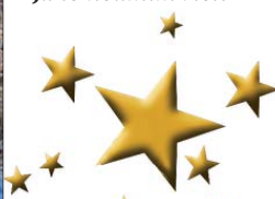
Pét'a (10 let)

Je velký jako já, má žlutý, modrý, a zelený vlasy, je to balón. Já to neumím říct!