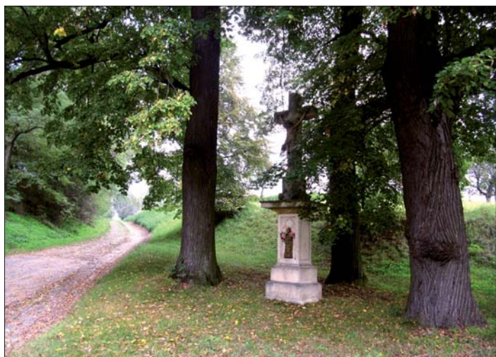
Dvojí tvář obce